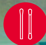
Rühr- und Wattestäbchen